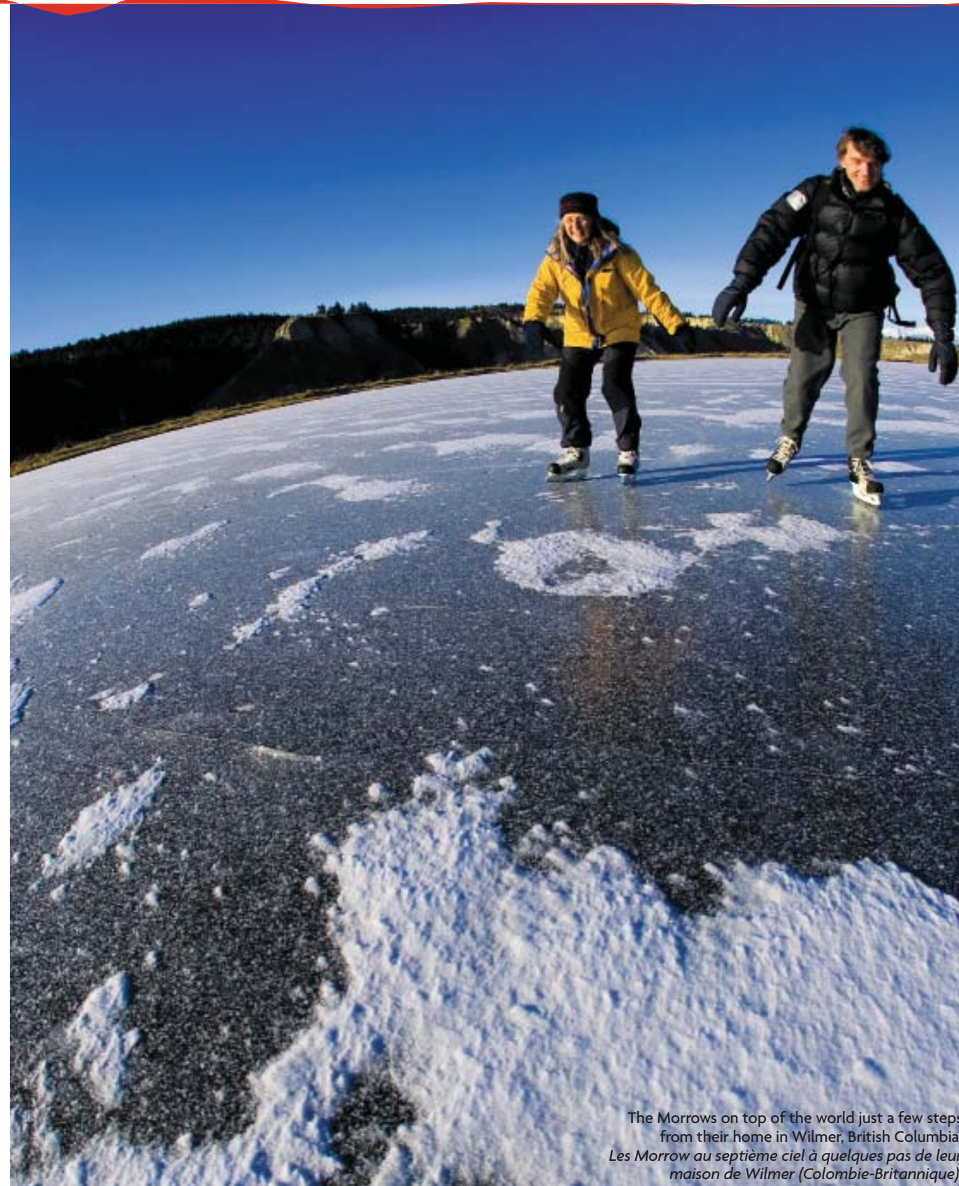
The Morrows on top of the world just a few steps from their home in Wilmer, British Columbia. Les Morrow au septième ciel à quelques pas de leur maison de Wilmer (Colombie-Britannique).